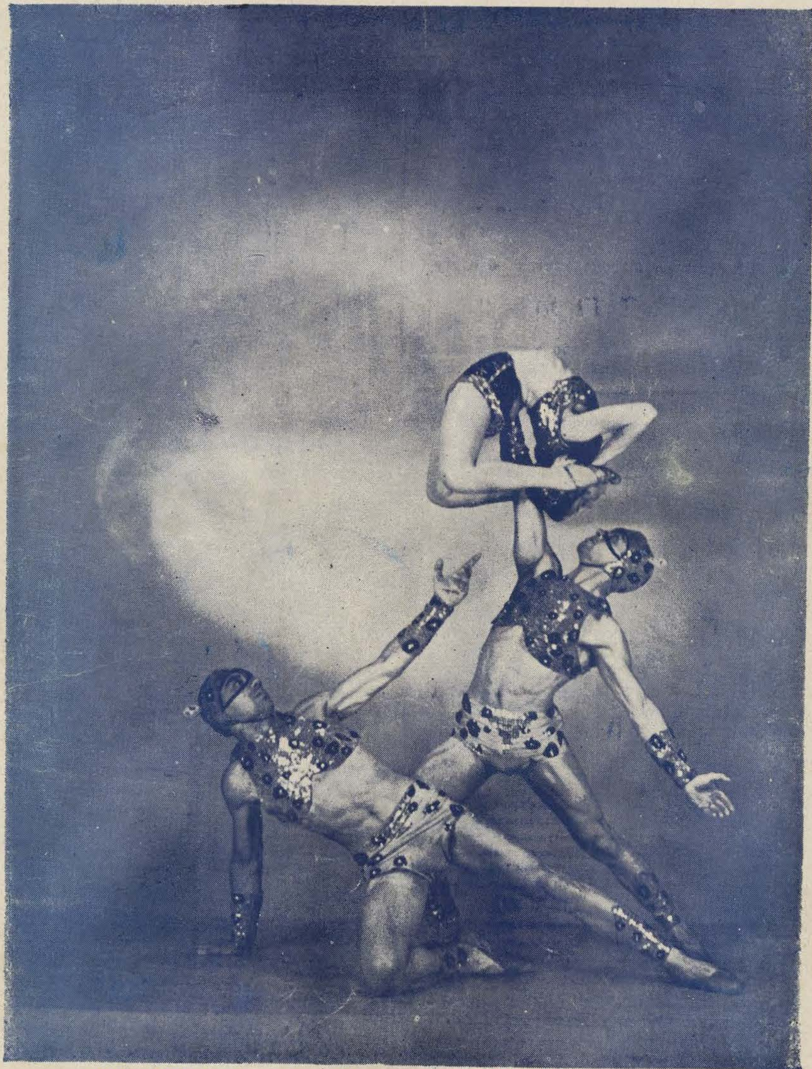
ТРИО ЛАРГО, пользующееся большим успехом в Шанхаѣ, в танцѣ „Ярость“. (См. очерк на стр. 17).