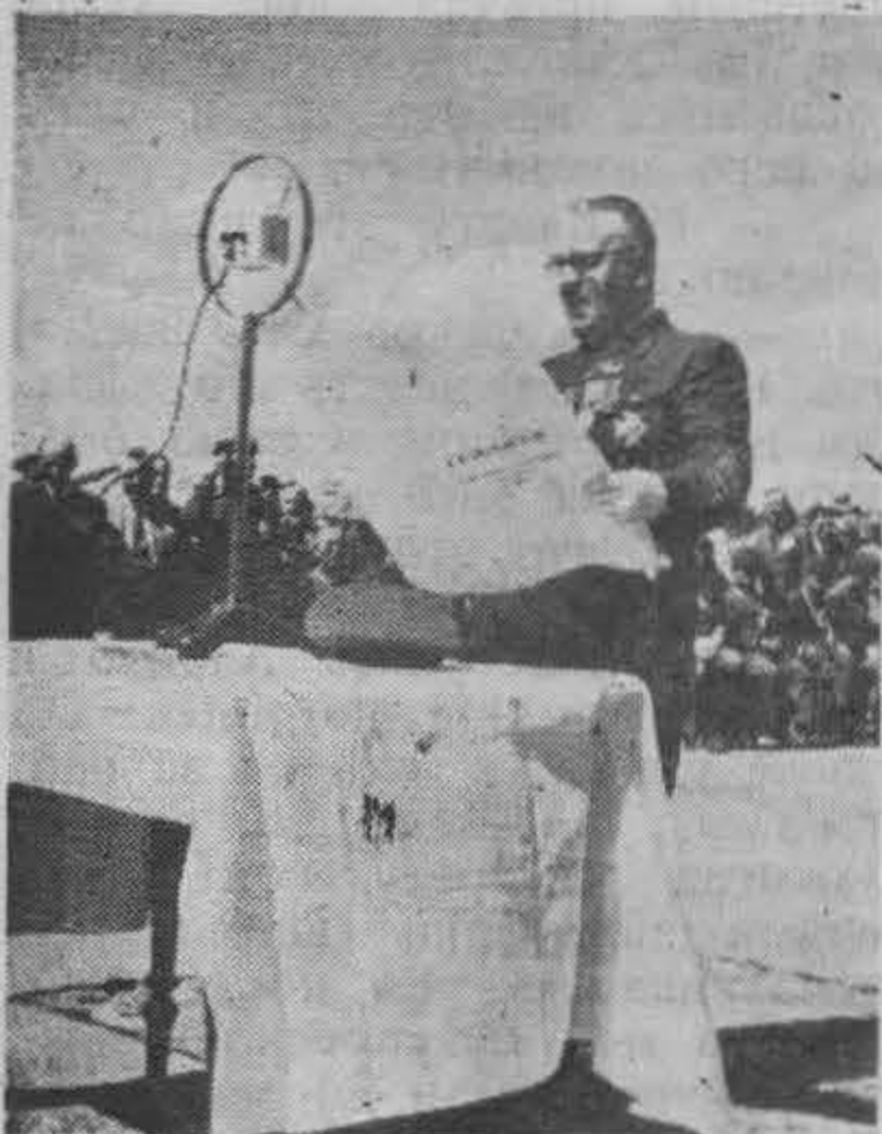
Ген. Кислицин зачитывает грамоту.

на русском языке сдвляли доклады о ходе постройки памятника. Слэдом состоялся парад организаций и школ, который был принят ген. Янагита и ген.