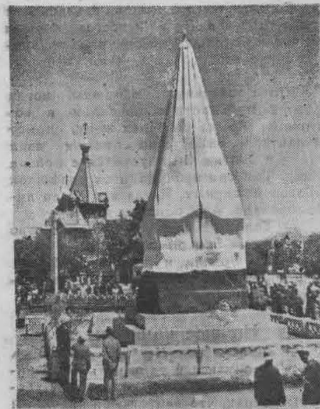
За нѣсколько минут до открытія памятника.

В Троицын день, 8 июня, в Харбинѣ, в особо-торжественной обстановкѣ, состоялось освященіе и открытіе памятника героям, павшим в борьбѣ за новый грядущій порядок.