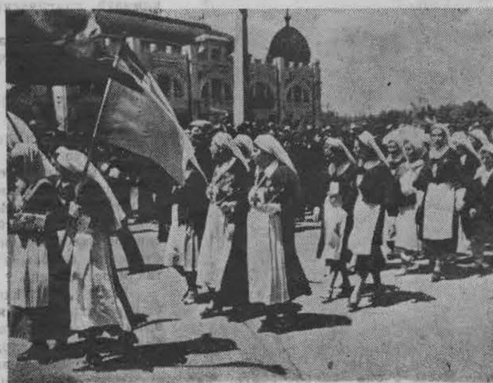
Сестры милосердія Маріинской общины.

на русском и ходѣ постройкѣ стоялся парадный был пр