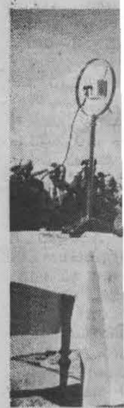
Ген. Кислицин Кислициным.

на русском и ходѣ постройкѣ стоялся парадный был пр