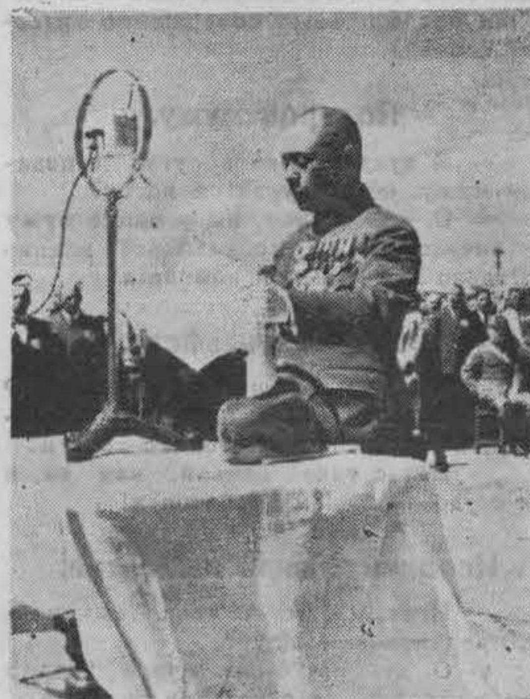
Ген. Янагита произносит рѣчь.

мощник городского головы г. Ямагучи и представитель Кио-Ва-Кай г. Ханда, охарактеризовали памятник, как символ единенія русских эмигрантов с народами