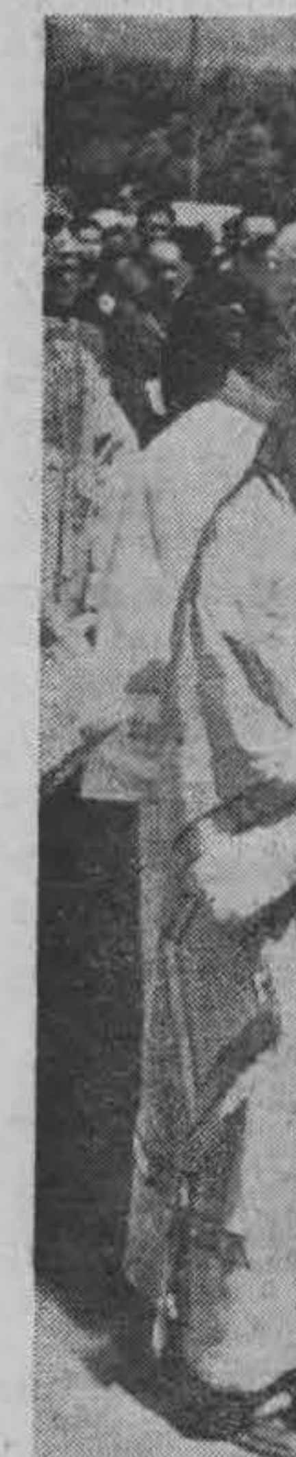
Присутствов Мелетій, с

Здѣсь при власти и наибвмигранты во г. Благодарственным представителям «За усердіе»