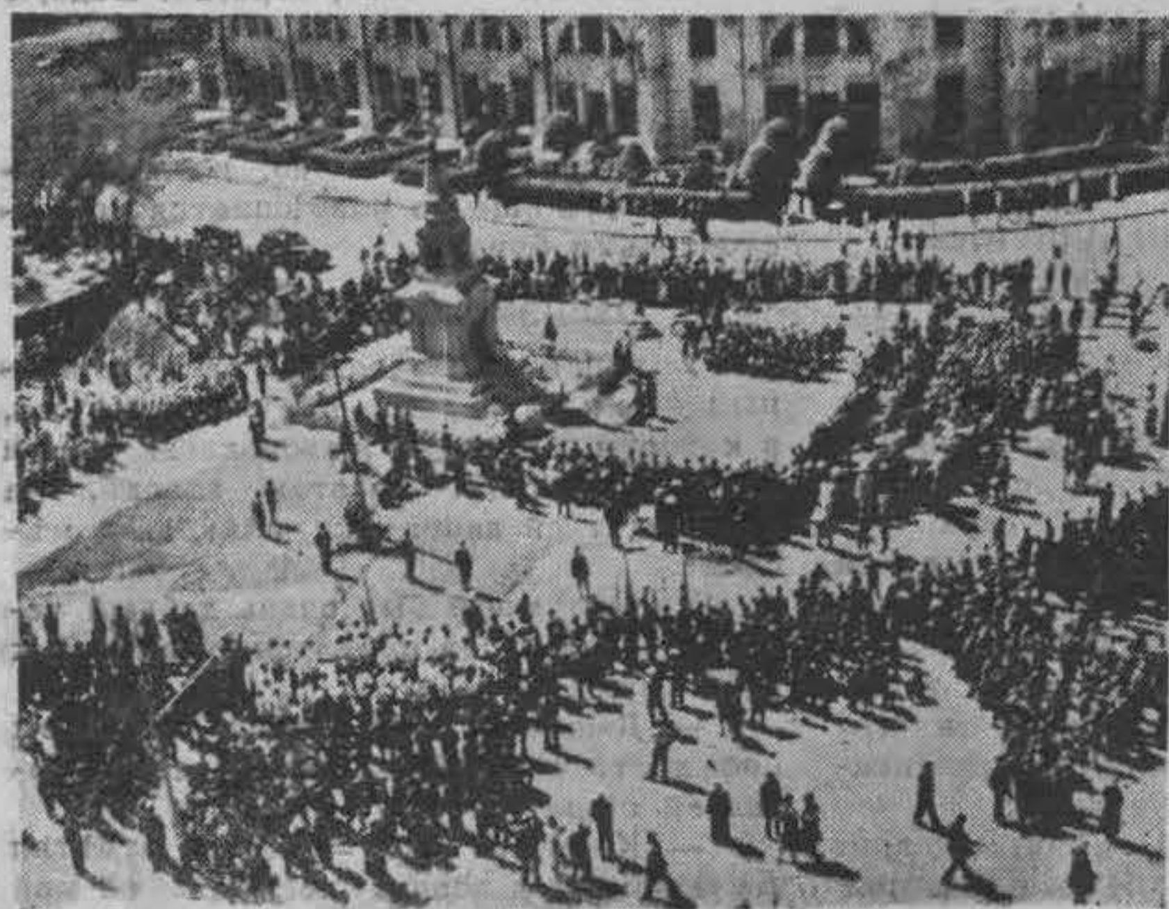
Общій вид соборной площади в день торжества.

Инициатором возведенія монумента явился начальник Главнаго Бюро эмигрантов, ген. В. А. Кислицин, который нашел горячую поддержку в лицѣ начальника военной миссiи ген. Хата и