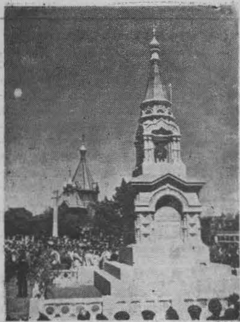
Общий вид памятника.

командования, высшей администрации и эмигрантской общественности, который прошел в торжественных тонах и в дружественной атмосфере.