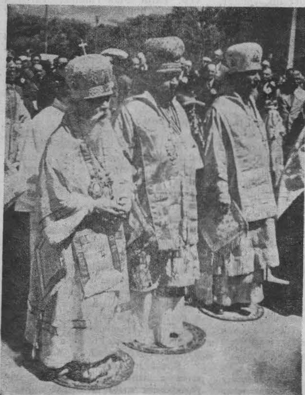
Присутствовавшие на торжестве иерархи: митрополит Мелетий, архиепископ Нестор и епископ Ювеналий.

Здсь присутствовали также высшя власти и наиболее видные российские эмигранты во главе с ген. Кислициным. Благодарственные грамоты были вручены представителям высших властей и знаки «За усердие» всем начальникам район-