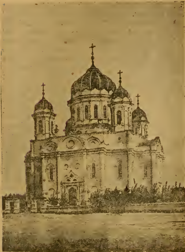
Томскій Каѳедральный Соборъ.