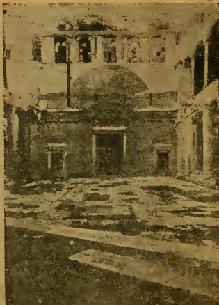
Храмъ въ честь св. Іоанна Богослова въ Константинополѣ. Внутренній видъ.

Изрекши это, Пречистая Богоматерь стала невидима“.