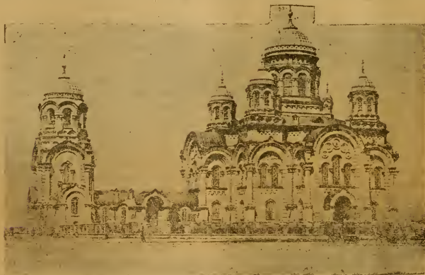
Г. Иркутскъ. Каведральный Соборъ.

Онъ поощрялъ разнообразныя мѣст- ныя экспедиціи и издавалъ труды науч- ныхъ изслѣдователей. По его инициати- вѣ возникли въ 1887 году публичныя