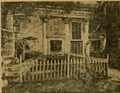
Древній Храмъ въ честь св. Іоанна Богослова. въ Константинополѣ.

умершаго 60-ти лѣтъ отъ роду, въ 407 году.