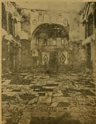
Остатки храма св. Іоанна Богослова въ Константинополѣ. Видъ на Алтарь.

Услышавъ этотъ голосъ, святой поспѣшно вышелъ изъ келліи въ сѣни;