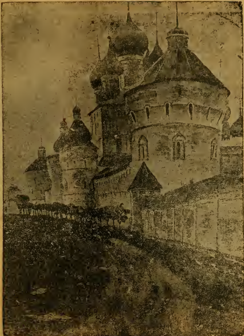
Ростовъ Великій. Видень храмъ св. Іоанна Богослова.