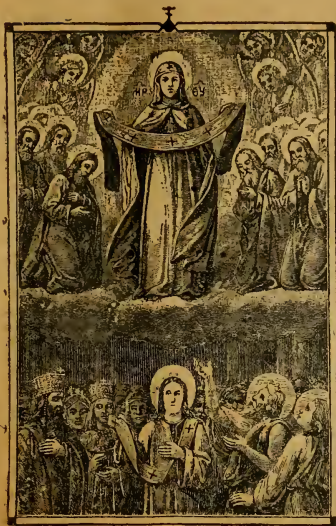
Видѣніе св. Андрея во Влахернской церкви.

(Іоанна Златоустаго), когда онъ, по обычаю своему, стоялъ ночью на молитвѣ, къ нему пришли святые апостолы Петръ и Іоаннъ, которые являлись къ нему и раньше, когда онъ подвизался въ Антиохійскомъ Монастырѣ. Святые апостолы сказали ему: