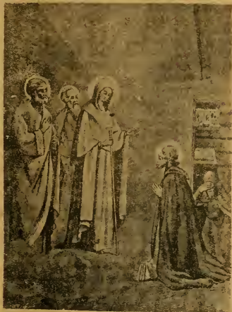
Явленіе св. Сергію Радонежскому.

и въ стихирахъ службы 26 сентября объ этомъ говорится: